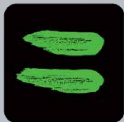
Athlete Central App

Du hast Probleme oder Fragen zu folgenden Themen?